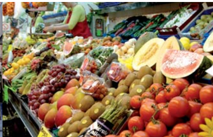
El 70% de les activitats es desenvolupen dins del nucli urbà

ara tallers de reparació de vehicles, perruqueries i centres d'estètica, centres sanitaris, entitats bancàries i gestories, entre d'altres. Aquest grup representa el 67% del total. El segueixen les activitats de restauració (ho són 312 de les 1.304 activitats de serveis registrades), entre les quals predominen els bars, cafeteries i restaurants.