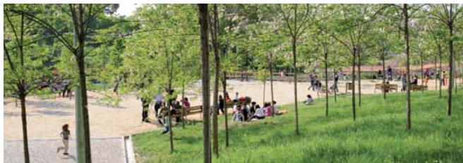
El parque de Ca n'Alzamora se ha ampliado

Los tres nuevos espacios suman casi 9 hectáreas de zonas verdes y de paseo, una superficie equivalente a la de nueve campos de fútbol. El incremento de zona de paseo va acompañado de un aumento de árboles: un centenar en la plaza Josep Tarradellas y cerca de 600 en Can Sant Joan.