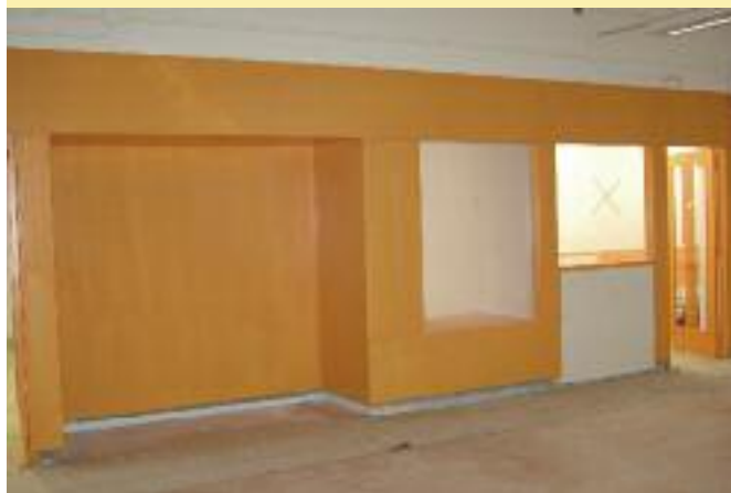
Obres a l'edifici Bullidor per l'escola bressol Sol, solet