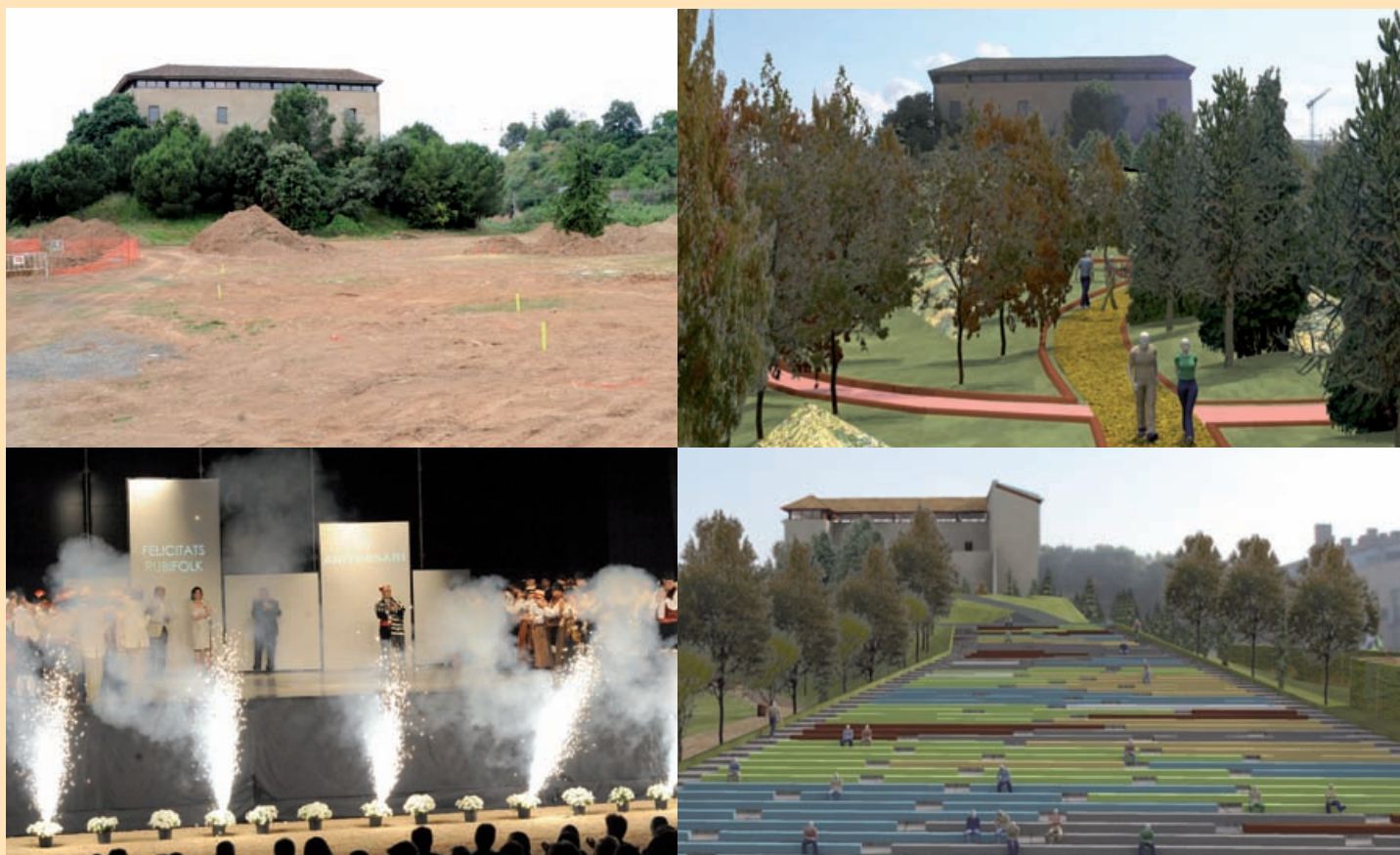
D'esquerra a dreta i de dalt a baix: Obres actuals on s'ubicarà l'arborètum, vista virtual de l'arborètum, escenari de l'amfiteatre, vista virtual de l'amfiteatre.

Amb aquesta actuació es pretén convertir aquest espai en un lloc més accessible per a la ciutadania i que ofereixi opcions de passeig i estada. L'objectiu del consistori és crear un entorn a tota la zona que dignifiqui i posi en valor tota la finca on es troba una de les construccions més emblemàtiques del municipi.