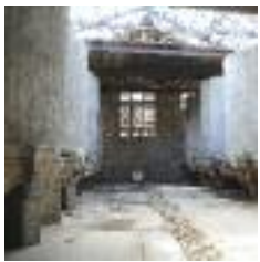
CELLER COPERATIU EL EDIFICI HISTÒRIC ESTÀ EN PLENA REHABILITACIÓ

L'arribada de l'estiu fa baixar el pols de la ciutat. Ja sigui per la calor, o bé per les vacances, sembla que l'activitat s'alenteixi. Malgrat aquesta percepció, allò que mantindrà el seu ritme previst seran les obres de posada a punt de la ciutat. Els que es passegin pels carrers de Rubí podran comprovar que continuen els treballs de rehabilitació dels edificis històrics, l'adequació dels equipaments públics o l'adaptació de les infraestructures. Fins i tot, n'hi ha que comencen durant el mes de juliol, aprofitant que l'activitat a la ciutat es redueix.