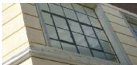
Detall de les franges a la façana i finestral