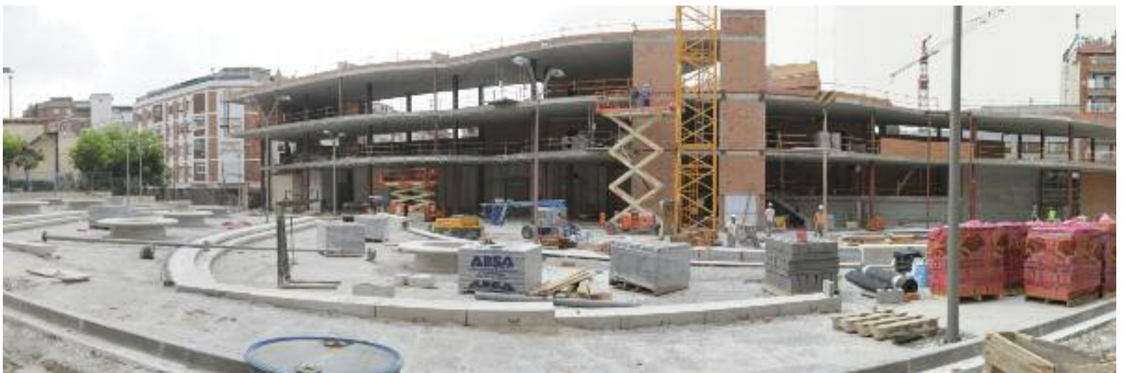
L'entron del Mercat Municipal continuarà en obres per la intervenció una integral

Davant dels equipaments i els edificis històrics, durant l'estiu continuaran també altres obres que responen a les necessitats més bàsiques. En aquest moment, s'estan construint habitatges de protecció oficial, per exemple, a la zona de Can Sant Joan, a Sant Jordi Parc i, des d'aquest mateix mes de juliol, a la Zona Nord, entre els carrers de Belchite i Lepant.