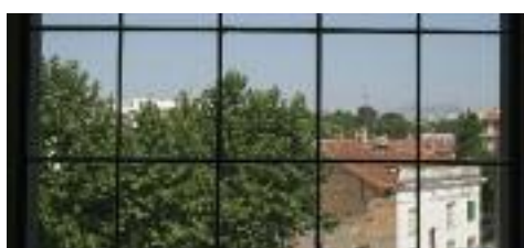
Vista des de l'interior a Montserrat