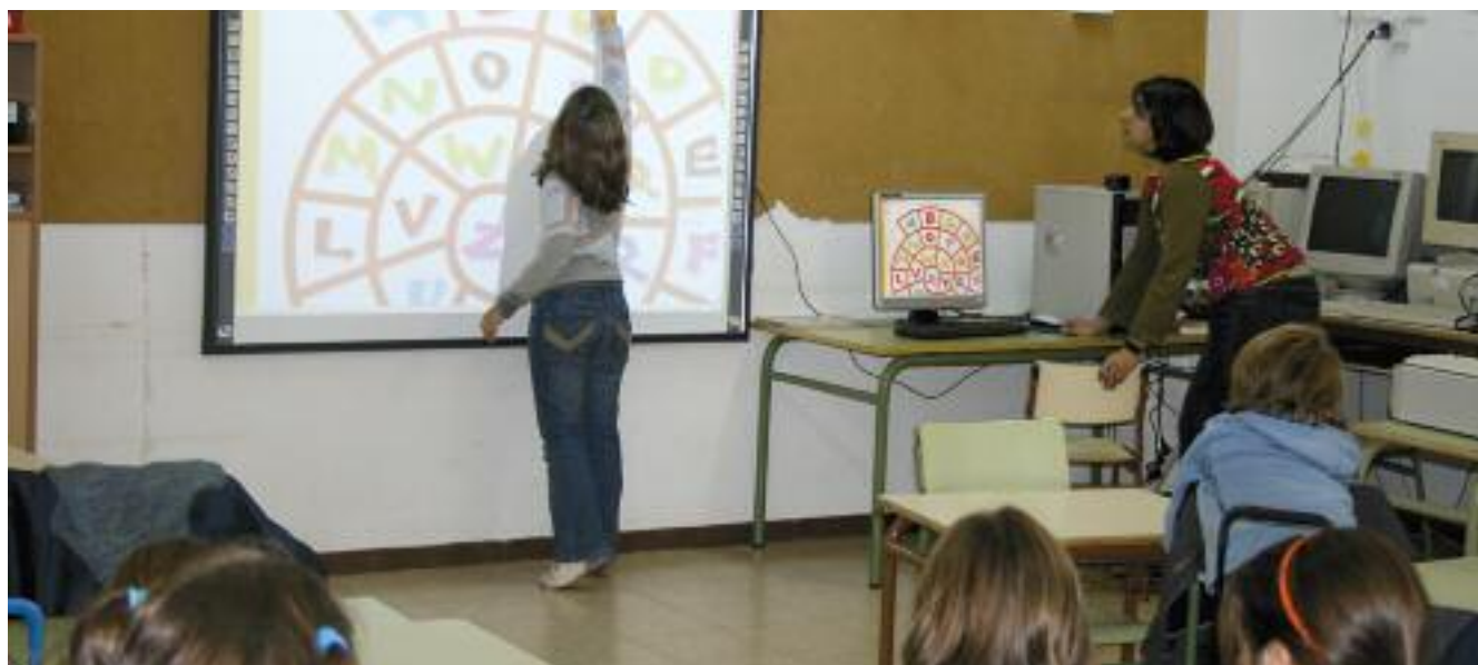
El curs escolar comença aquest any una setmana abans

El pròxim curs, 9.204 alumnes començaran els ensenyaments obligatoris a partir del 7 de setembre, una setmana abans del que era habitual fins ara. La xifra de nous alumnes que comencen el curs a P3, que aquest any estre-