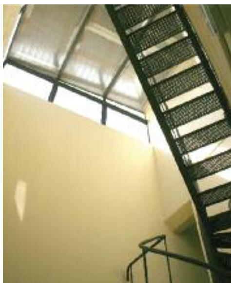
Escales i pont interior