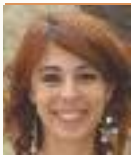
ERC Arés Tubau Portaveu del Grup Municipal d'ERC

El burca i/o el nicab són, a més a més, un obstacle importantíssim a la integració dels ciutadans nous i noves.