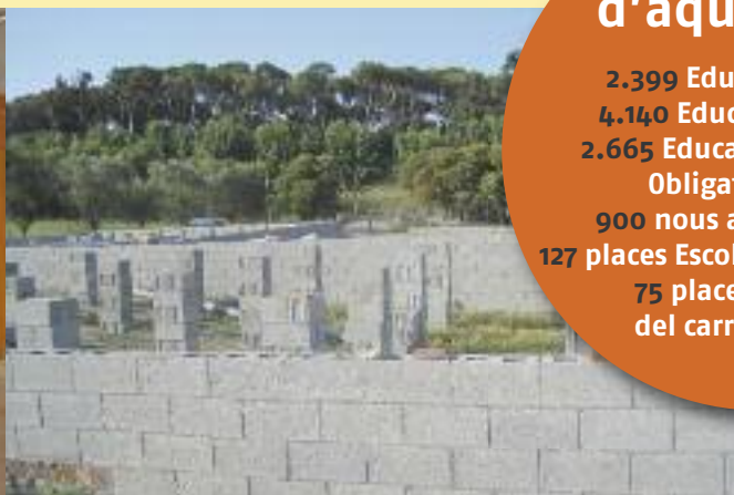
Inici de construcció de la nova escola del Carrer Mallorca