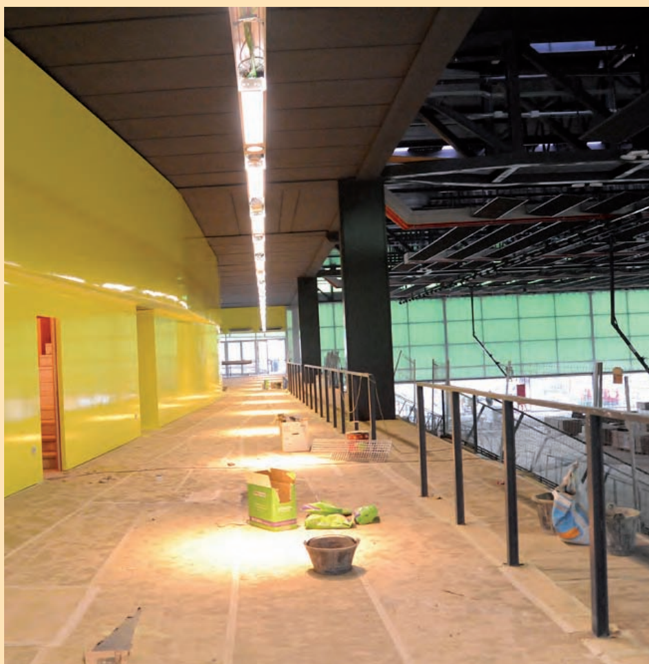
El pavelló de La Llana s'està construint en un solar de 13.971 m 2