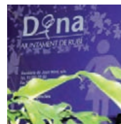
20 DONES HAN SOL·LICITAT A RUBÍ LA TELEASSIS- TÈNCIA MÒBIL

vitat en què poden participar tant adults com nens i nenes, recorrent un circuit de 400 metres d'anada i tornada. El trajecte, que es podrà fer caminant, passejant o en patinet, s'ubicarà a la rambla del Ferrocarril a partir de les 11 hores, on, de forma simultània, es farà també la lectura del manifest del Dia contra la Violència de Gènere.