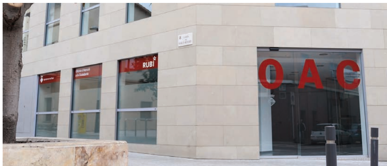
El nuevo edificio de la OAC abre sus puertas el 15 de noviembre

Por otra parte, cabe destacar que en la Carpeta Ciudadana los trámites se clasifican según si se accede con o sin identificación. Para conseguir