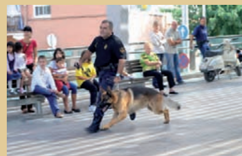
2009. Exhibició de la unitat canina.