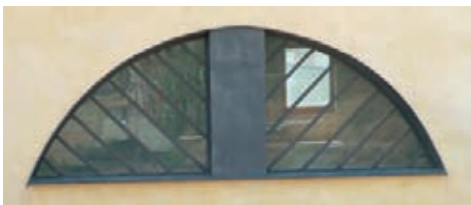
Finestra de nova factura