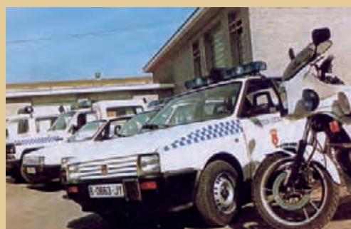
1989 - 1990. Parc mòbil de la Policia Local.