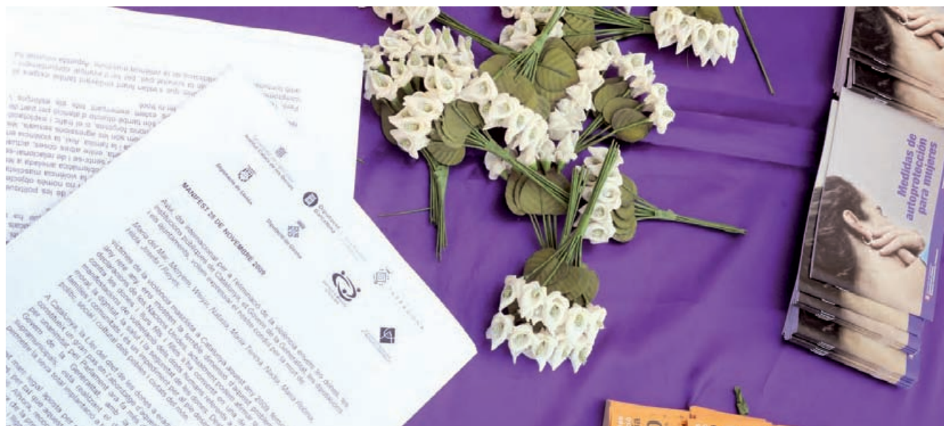
Entre altres activitats, es recullen signatures a diferents punts de la ciutat.