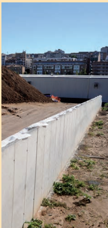
En aquests moments s'estan enllestit els sistemes de contenció.

S'estan habilitant dos accessos directes des del carrer del Pont de Can Claverí: un per a vianants, que condueix directament al complex esportiu; i un altre per al trànsit rodat, que connecta amb