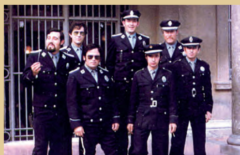
1978. Foto dels membres de la Policia Local