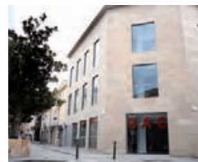
NOVA OAC S'IMPULSARÀ LA TRAMITACIÓ TELEMÀTICA I TELEFÒNICA

L' Oficina d'Atenció al Ciutadà (OAC) del centre s'ha traslladat al nou edifici del carrer Narcís Menard on, des del dilluns 15 de novembre, va començar a prestar els serveis a la ciutadania en aquest nou equipament municipal, en el seu horari habitual: de dilluns a divendres de 8.30 a 14 i de 16 a 19 h i els dissabtes de 9 a 13 h.