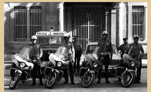
1973 - 1974. Els policies davant l'Ajuntament amb els vehicles del cos.