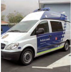
NUEVOS VEHÍCULOS EL PARQUE MÓVIL SE HA MODERNIZADO EN LOS ÚLTIMOS AÑOS

C ent anys han fet canviar els organigrames de la Policia Local, algunes competències, els protocols d'actuació, les eines del seu treball i moltes més coses, però no han modificat una premissa que ja ve dels temps de Miquel Domé, el primer guàrdia: ésser la referència de seguretat més propera per als rubinencs.