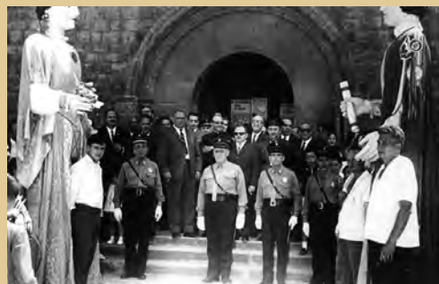
1969. El agents de l'epoca entre els gegants a les festes de Sant Roc.