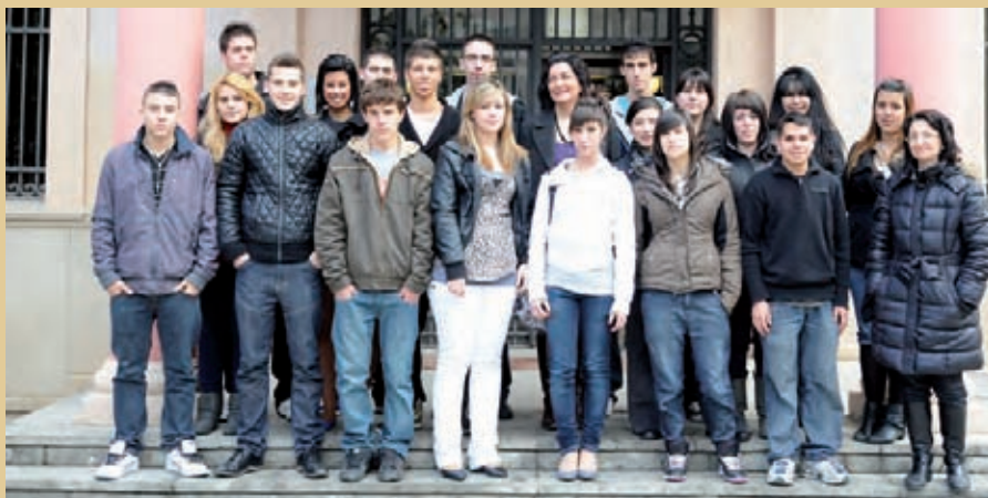
Alumnes de l'Escola Regina Carmeli van visitar l'Ajuntament