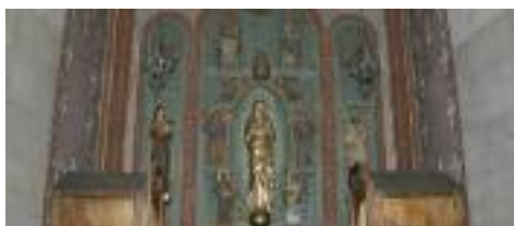
Un dels altars interiors