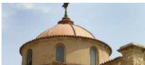
Detall de la cúpula