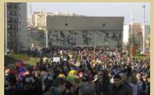
La rambla del Ferrocarril acull activitats infantils diumenge al matí