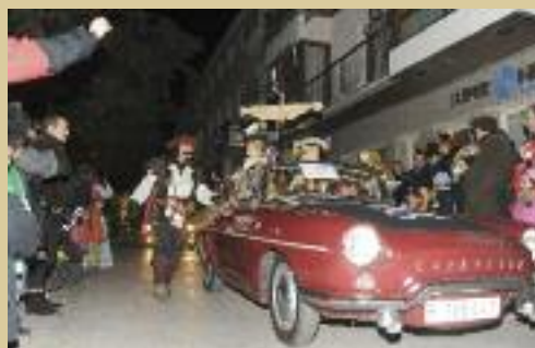
Al concurs de comparses van participar l'any passat 20 grups