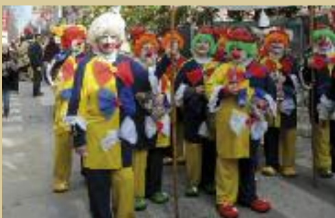
Rua infantil de l'any passat.