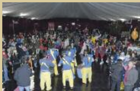
A l'envelat es fa el lliurament del concurs de comparses