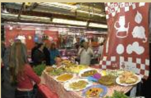
Al concurs de truites es fa una degustació popular

Diumenge 6 de març a les 11.30 h: tissorada infantil per inaugurar la plaça del Dr. Guardiet