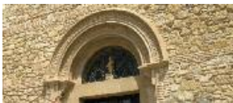
Arc de la porta que dona a la plaça