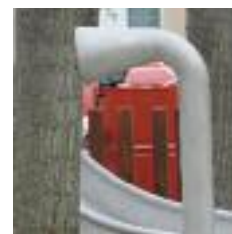
ZONA INFANTIL LA NOVA PLAÇA DISPOSA D'UNA ZONA DE JOCS INFANTILS EN UN DELS SEUS EXTREMS

Abans que comencessin les obres de remodelació, l'espai central de la plaça estava ocupat per un amfiteatre que només s'utilitzava de forma molt esporàdica com a atri de l'església de Sant Pere i com a escenari d'espectacles culturals de gran envergadura que en breu es podran realitzar al nou auditori a cel obert del Castell. Com a resultat de les obres, la nova plaça té un únic nivell i està pavimentada amb pedra natural de color ocre, combinada amb franges de quarsita vermella. A prop de la sortida de l'església, s'hi ha col·locat una font ornamental, mentre que als dos extrems de la plaça es concentren dues zones de descans amb bancs, gespa i espais de jocs infantils.