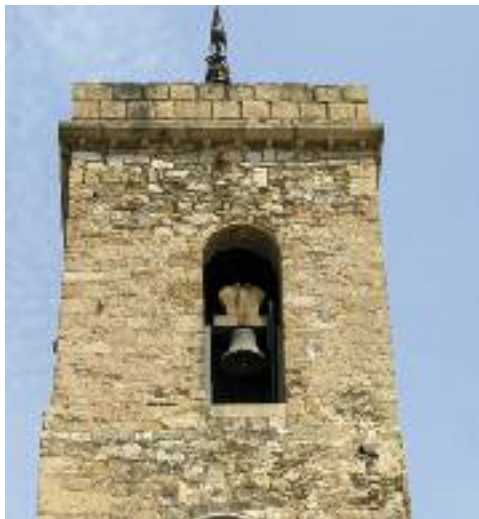
La torre de l'església