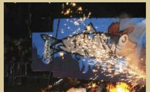
L'enterrament de la sardina posa fi a la festa de Carnaval