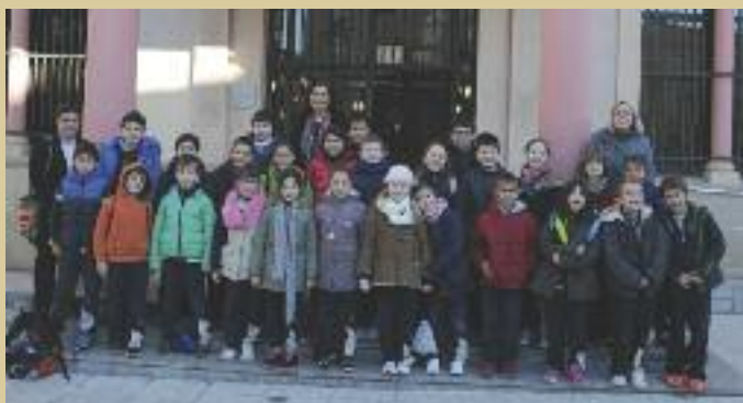
Alumnes del Col·legi Maristes van visitar l'Ajuntament