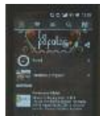
NOVA APP MÒBIL JA S'HA POSAT EN MARXA L'APP QUE ELS COMERÇOS PODRAN UTILITZAR

A començament de juliol s'obrirà el termini de presentació de la segona edició de les subvencions a la millora iniciativa comercial, uns ajuts que volen atraure nous comerços a la ciutat i fomentar l'emprenedoria comercial. A més, per a 2014, hi haurà dos premis de 5.000 euros cada un per a dues iniciatives que siguin de nova implantació o s'hagin posat en funcionament al llarg d'aquest any. Les propostes es podran presentar fins a final de setembre.