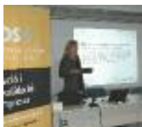
MESURES ANTI-CRISI 2014 L'AJUNTAMENT DESTINARÀ 3,6 MILIONS D'EUROS

d ins el Pla de mesures anticrisi 2014, l'Ajuntament destina prop d'1,4 milions d'euros a accions de foment de l'ocupació i l'emprenedoria i 588 mil euros més a propostes de suport al teixit econòmic. Unes i altres acaben perseguint uns mateixos objectius vinculats a la lluita contra la crisi: la reactivació econòmica i la generació de llocs de treball.