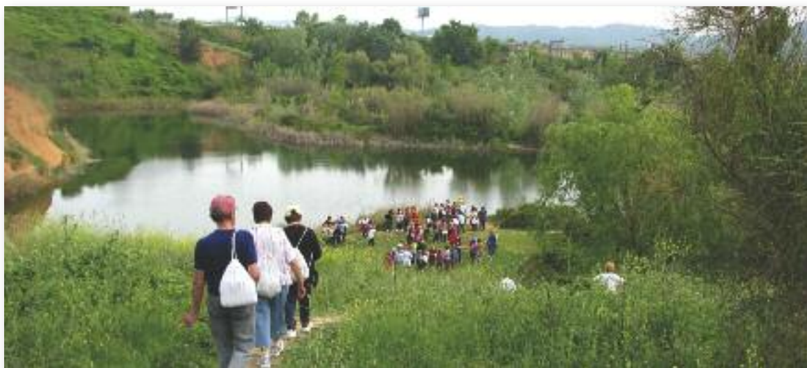
Uno de los recorridos realizados por el Torrent dels Alous

dos de autoprotección y de cuidado del medio ambiente, que se trabaja mediante unas fichas que se entregan a los participantes. Por otra parte, se trabajan contenidos de conocimiento del patrimonio natural en función de la ruta realizada. Para elaborar tanto los recorridos como el material, el servicio de deportes ha contado con la colaboración