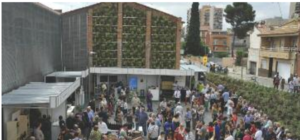
La Fira del Vi de Rubí es torna celebrar el 25 i 26 d'octubre

També el cap de setmana del 25 i 26 d'octubre, el Cellar torna a acollir la celebració de la II Fira del Vi de Rubí, on els assistents podran tastar alguns dels vins guardonats als Premis Vinari 2014, el concurs de vins de Catalunya, que va celebrar el tast final al setembre en aquest espai de la ciutat.