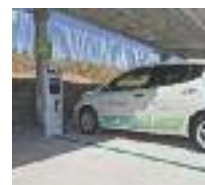
FOTOLINERA UNA IMATGE DE LA FOTOLINERA SITUADA A LA MASIA CAN SERRA

Amb la celebració d'aquest congrés, la ciutat es consolida com un referent nacional i internacional en eficiència energètica i energies renovables. Un camí que es va iniciar el 2011 amb la posada en marxa del projecte municipal Rubí Brilla, orientat al foment de l'estalvi i l'eficiència energètica a la ciutat mitjançant la implicació de tots els agents possibles. En el marc d'aquesta iniciativa, s'estan desenvolupant diferents projectes dins l'administració, en l'àmbit residencial, el comerç i la indústria, amb uns bons resultats que han despertat l'interès d'altres municipis, tant de l'Estat com d'altres punts d'Europa.