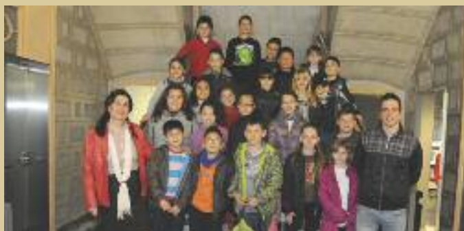
Alumnes de l'Escola Montserrat van visitar l'Ajuntament