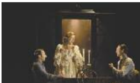
El zoo de vidre es podrà veure al novembre a La Sala