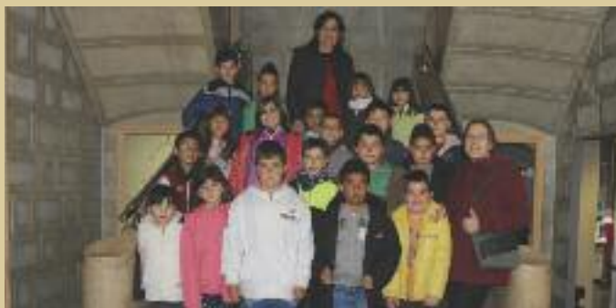
Alumnes de l'Escola Joan Maragall van visitar l'Ajuntament