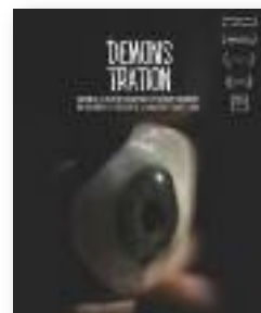
DOCUMENTAL DEL MES CARTELL D'UNA DE LES PROJECCIONS QUE ES FARAN

Quasi de forma paral·lela, però a la Sala Cèsar Martinell, s'inaugurarà el 17 d'octubre "R+V. Rubí i el vermell", una exposició desenvolupada per alumnes i professors de l'Escola d'Art i Disseny EDRA, amb la col·laboració literària de l'escriptor Enric Larreula. R + V és una reflexió sobre el territori i l'origen etimològic de Rubí amb peces a través de les quals pren significació la ciutat i la raó de ser per mitjà del color.