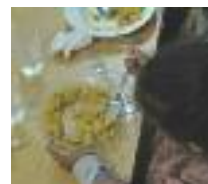
BEQUES MENJADOR L'AJUNTAMENT APORTARÀ MÉS DE 400.000 EUROS A LES BEQUES