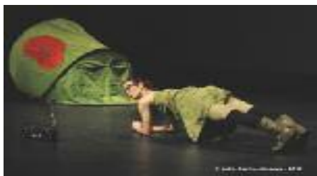
Babaol és un espectacle de dansa per al públic familiar