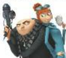
"Gru2", cinema en català a la Biblioteca

QUAN EL MÓN NECESSITA UN HEROI, LA MILLOR SOLUCIÓ ÉS UN DOLENT