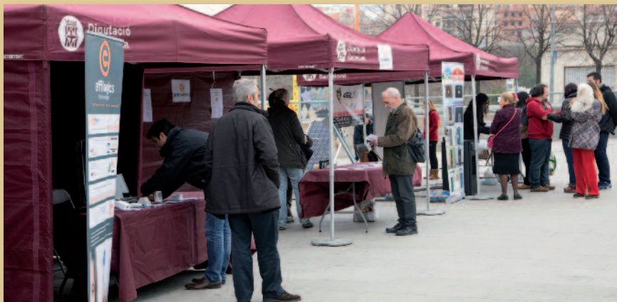
Una fira va reunir entitats de l'àmbit de l'eficiència energètica i el consum responsable

gaudir de les activitats organitzades al voltant d'aquesta mostra, entre les quals hi havia jocs infantils, un circuit de prova del cotxe elèctric i dos tallers sobre la factura elèctrica i l'eficiència energètica.