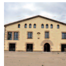
OFICINA DE SERVEIS A L'EMPRESA ESTÀ SITUADA A LA MASIA CAN SERRA

t ens una idea empresarial però no saps per on començar? Tranquil, no estàs sol, el Servei de Creació d'Empreses de l'Ajuntament de Rubí, ubicat a la Masia de Can Serra, et pot ajudar a fer realitat el teu projecte assessorant-te de forma gratuïta des del primer moment i fins a la constitució de la teva empresa. T'ho expliquem en quatre passos.