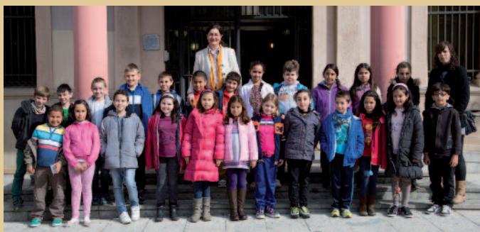
Alumnes de l'Escola Mossèn Cinto Verdaguer van visitar l'Ajuntament