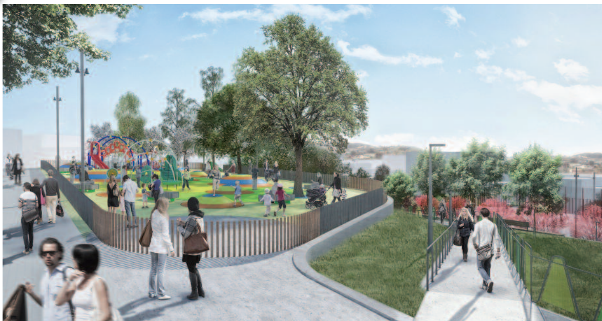
Imatge virtual de la zona de jocs infantils per a nens de 2 a 12 anys del nou parc de La Serreta

L'Ajuntament de Rubí ha iniciat recentment les obres per construir el nou parc de la Serreta, un espai d'esbarjo llargament reivindicat pels veïns del barri de la Zona Nord de la ciutat. Aquesta actuació, pressupostada amb 1,7 milions d'euros, ha estat adjudicada a l'empresa Ferroviària i és una de les actuacions previstes al Pla d'inversions financerament sostenible 2014-2015. Les obres tindran una durada aproximada d'entre 9 i 10 mesos.