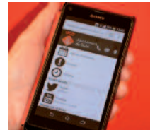
APP MÓVIL LA APP DEL AYUNTAMIENTO OFRECE LAS ÚLTIMAS NOTICIAS Y ACTIVIDADES DE AGENDA