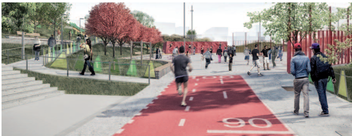
Imatge virtual de l'entrada principal del nou parc de la Serreta, pel c/ Carrasco i Formiguera

proposen noves experiències de joc: s'han dissenyat topografies artificials per a nens i nenes més petits i d'altres per a més grans, com un rocòdrom, que fomenten les activitats a l'aire lliure, més enllà dels jocs tradicionals.