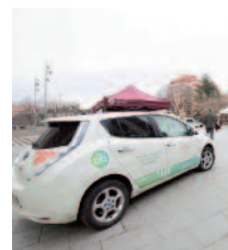
EL COTXE ELÈCTRIC UNA DE LES ATRACCIONS DEL DIA MUNDIAL DE L'ENERGIA