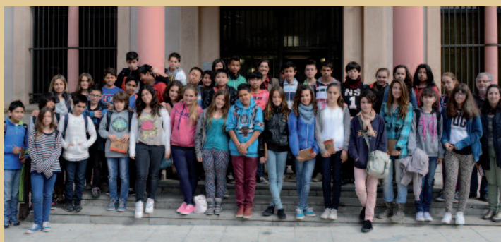
Alumnes de l'Institut L'Estatut van visitar l'Ajuntament