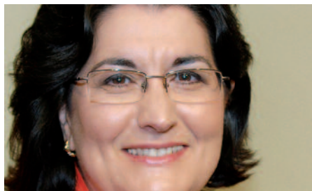
CARME GARCÍA LORES Alcaldeessa de Rubí

Els veïns més propers al parc de la Serreta, a la Zona Nord, veuran en pocs dies com ja comencen les obres de remodelació d'aquest espai. Aquest parc, que esdevindrà una de les referències del Rubí actual, serà amb tota seguretat un motiu d'orgull per als veïns més propers, però de ben segur que també representarà un punt de trobada i lloc d'esbarjo i oci per al conjunt de la ciutadania.