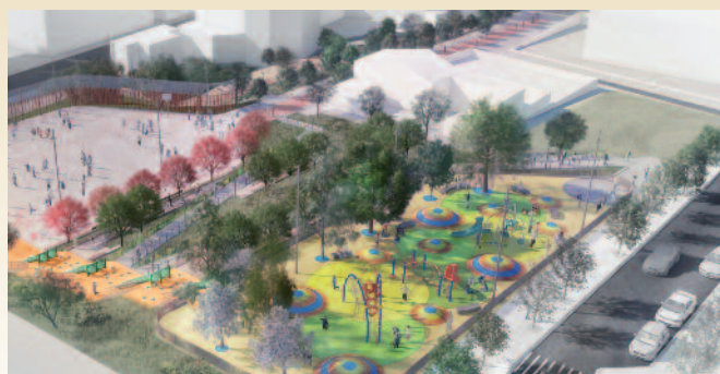
Imatge virtual del futur parc de la Serreta

per la remodelació de diverses places o la millora de carrers i voreres tant al nucli urbà com als polígons industrials, entre d'altres.