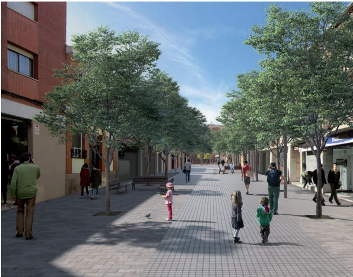
OBRES D'ADEQUACIÓ TAMBÉ S'HA ACTUAT A L'ENTORN DEL MERCAT

Un dels objectius d'aquest mandat és recuperar el carrer per a les persones.