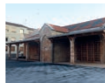
PUNT D'INFORMACIÓ DE FESTA MAJOR ENGUANY ES TRASLLADA A L'ESPAI TREMUJA DEL CELLER.