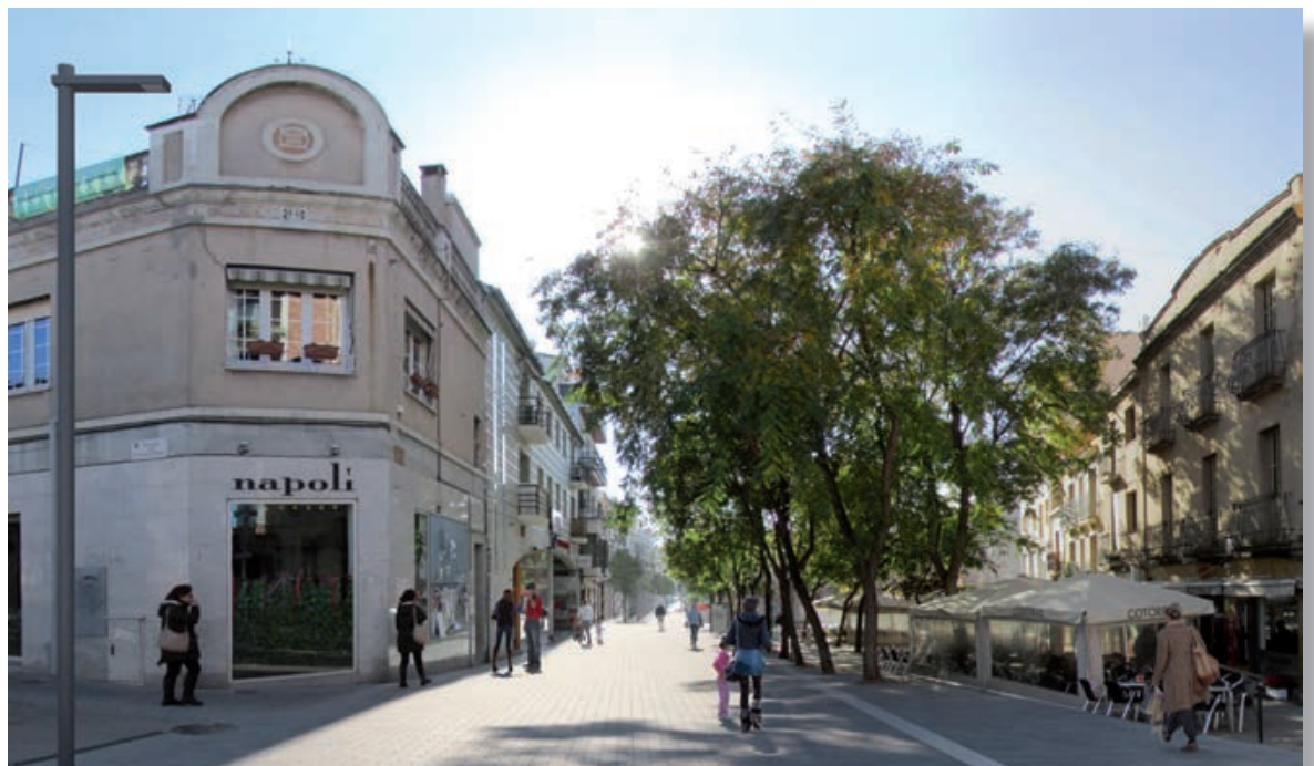
CARRER MAXIMÍ FORNÉS

L' Ajuntament de Rubí aposta per convertir el centre de la ciutat en una autèntica illa de vianants. Per aconseguir-ho, a més de limitar els vehicles que hi poden circular, també està executant unes obres que, entre d'altres, permetran anivellar les voreres i la calçada, creant una plataforma única.