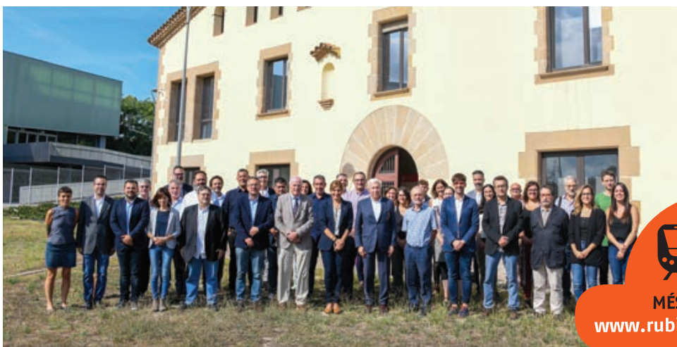
Assistents a la presentació de la Declaració de Can Serra

Des de llavors, l'estació de La Llana s'ha incorporat repetidament al planejament territorial del govern català –recentment, al Pla director d'infraestructures 2021-2030 i al Pla específic de mobilitat del Vallès–, però també de manera reiterada el projecte ha quedat relegat en un calaix, sense dotació pressupostària que en permeti l'execució. La Declaració de Can Serra vol relançar la demanda de la segona estació tot apel·lant a l'ampli consens que hi ha al darrere.