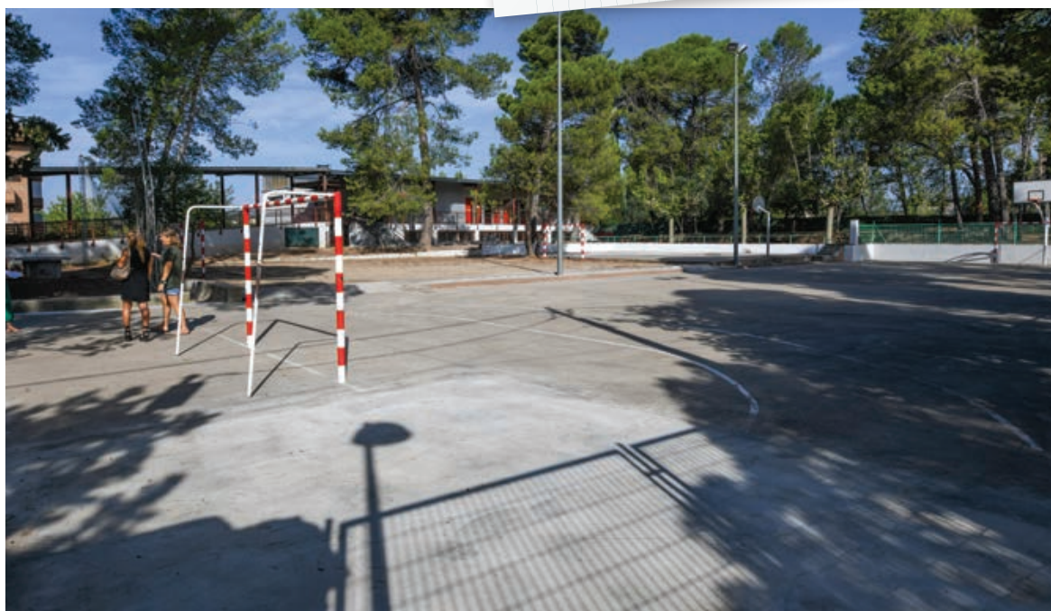
Tambés s'ha remodelat el pati de l'Escola Torre de la Llebre.