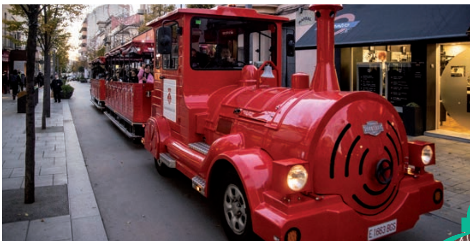
El Trenet dels Comerciants tornarà a recórrer els carrers de la ciutat.

Després de més de dos anys de pandèmia, Rubí recupera tradicions tan enyorades com la cavalcada de Reis, el campament del Mag Rubisenc o la festa de Cap d'Any; i dona continuïtat a propostes de dinamització comercial plenament consolidades com els tallers i espectacles familiars de la Carpa de Nadal, el Tió Gegant i el Trenet dels Comerciants, o la Fira de Nadal. També es manté el NadalARTS, la iniciativa que, de la mà de l'Escola d'Art i Disseny edRa i els il·lustradors i il·lustradores locals, vesteix de creativitat els aparadors dels comerços.