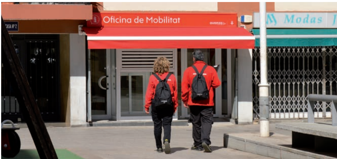
..... L'Oficina a la plaça de la Constitució .....

La ciutadania hi pot adquirir títols de transport locals, tramitar queixes i suggeriments i recuperar objectes perduts, entre d'altres gestions