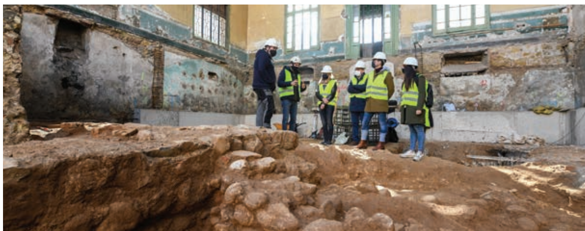
La remodelació ha descobert restes arqueològiques romanes.