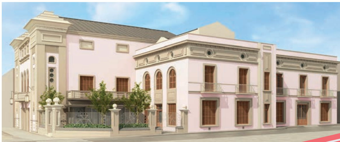
La façana es remodela seguint l'estil noucentista original.

meticulós i prudent per evitar danys i, d'aquesta manera, mantenir les característiques originals del Casino. Pel que fa l'ornamentació, la segona fase dels treballs inclou recuperar elements com les estàtues i llums decoratives.