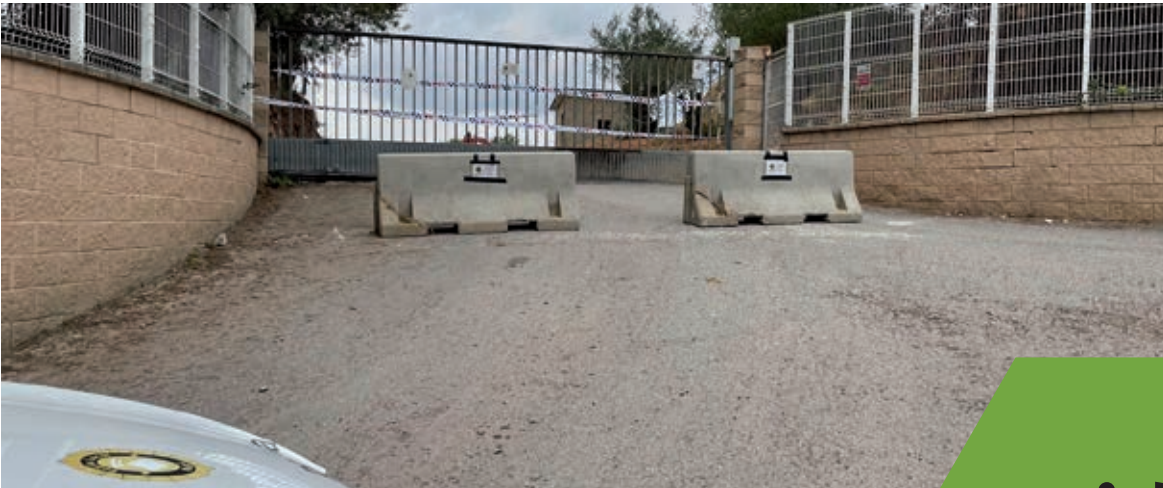
Precintament de la finca «La Nueve» per part de la Policia Local al setembre de 2021.

L' Ajuntament de Rubí ha multat amb un total de 630.000 euros els responsables dels abocaments incontrolats de residus a «La Nueve». A banda de les sancions econòmiques, la resolució dictada pel Consistori també requereix a les persones i empreses responsables restaurar la realitat física alterada.