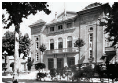
Plaça Salmeron en el moment de la seva inauguració

A banda de l'edifici annex, alguns elements interiors del Casino com ara la sala polivalent, la zona de camerinos i altres estances ja estan prenent forma. Una de les característiques que fan del Casino un edifici peculiar és l'ornamentació interior i exterior. En aquest sentit, ja s'està treballant en la neteja i recuperació de les motllures originals de les parets dels diferents àmbits de l'interior. Recuperar aquestes parts de la decoració implica un treball