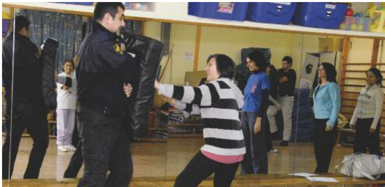
Una de les activitats, el taller de defensa personal per a dones.

tra la Violència de Gènere, que l'alcaldeessa i altres homes representants de la societat rubinenca fan cada any, i que aquest any serà a la