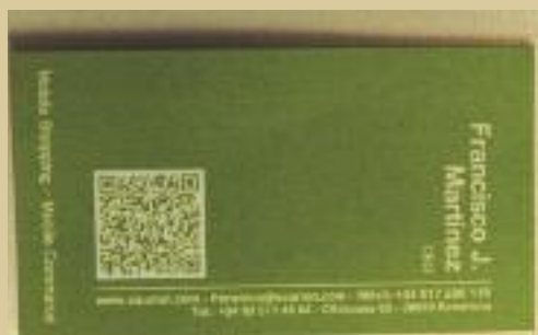
Tarja de visita amb informació QR

El projecte, anomenat QRcodificació dels carrers de Rubí, s'ha treballat a les escoles 25 de setembre, Rivo Rubeo, Montessori, del Bosc, Joan Maragall i Pau Casals. Permetrà la instal·lació de 18 plaques amb codis QR a diferents carrers de la ciutat. El guardó del Premi Educared 2011, atorgat com a Premi especial en la categoria de tecnologia mòbil i uns dels tres que es concedeixen a Catalunya, es va lliurar a l'octubre en el marc del VI Trobada Internacional Educared 2011 a Madrid. El projecte recull els treballs de l'alumnat dels diversos centres assistents a un seminari TIC a Rubí durant el qual els alumnes havien de treballar el nom d'alguns dels carrers propers a l'escola amb textos, imatges fixes, vídeos i àudio capturats amb telèfon mòbil que han publicat a la xarxa, creant un bloc per cada carrer, tot i que, en alguns casos, el codi QR generat s'ha dirigit a una adreça d'un web amb informació de l'escola. Tots els codis QR generats a partir de la informació treballada pels centres els està estampanant l'Escola d'Art i Disseny (EdRA) de Rubí, i s'aniran col·locant durant les pròximes setmanes.