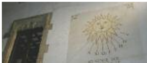
Rellotge de sol de la façana principal