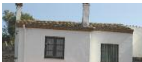
Detall de la casa principal