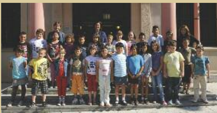
Alumnes de l'Escola Ca n'Alzamora van visitar l'Ajuntament