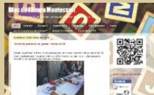
Exemple de codi QR incrustat a un bloc d'un ampa de Rubí