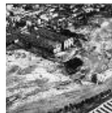
ZONA ESCARDÍVOL FOTO DE L'ARXIU ROSET DE COM VA QUEDAR LA ZONA DE L'ESCARDÍVOL

f acebook i Twitter s'han unit al bloc de la rierada per commemorar el 50è aniversari d'aquesta tragèdia que va marcar la població l'any 1962. Per mitjà d'aquestes xarxes socials es donaran a conèixer totes les novetats que s'incorporen al bloc www.rubi.cat/rierada i permetran la participació de ciutadans i ciutadanes a les xarxes.