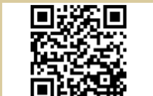
QR del Portal immobiliari impulsat per l'Oficina de Serveis a l'Empresa