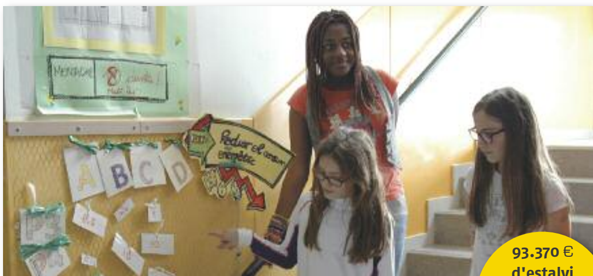
Alumnes amb el panell energètic

93.370 € d'estalvi energètic durant el curs 2013-2014