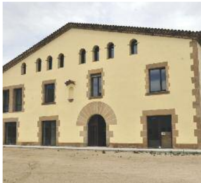
Masia de Can Serra

Actualment, a la demarcació de Barcelona hi ha un total de 264 punts PAE, dels quals 42 són públics i realitzen més del 75 % dels tràmits.