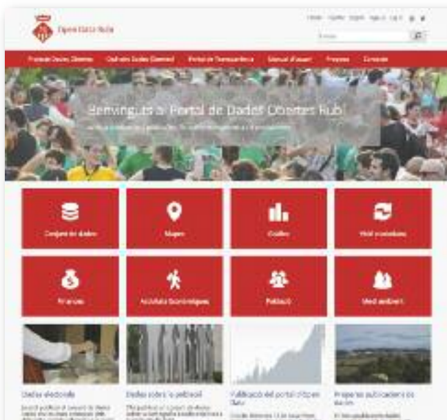
Open Data Rubí permite consultar e información pública

En este portal, que cuenta con versión en catalán, castellano e inglés, se irán añadiendo nuevos datos que se vayan generando que, aparte de ser con-