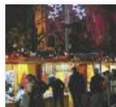
FIRES DE NADAL LA PL. DOCTOR GUARDIET ACULL DIFERENTS FIRES NADALENQUES

T allers nadalencs a la Biblioteca Mestre Martí Tauler i l'Ateneu per a tota la família acompanyaran les ja tradicionals activitats nadalencques a diferents espais de Rubí. Unes activitats que van començar el 9 de desembre amb l'hora del conte a la biblioteca i que finalitzaran la Cavalcada de Reis el 5 de gener. Conjuntament a les activitats organitzades per la Regidoria de Cultura, la Regidoria de Comerç també ha creat un programa de dinamització comercial i de ciutat.