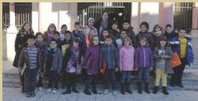
Alumnes de l'escola 25 de Setembre van visitar l'Ajuntament