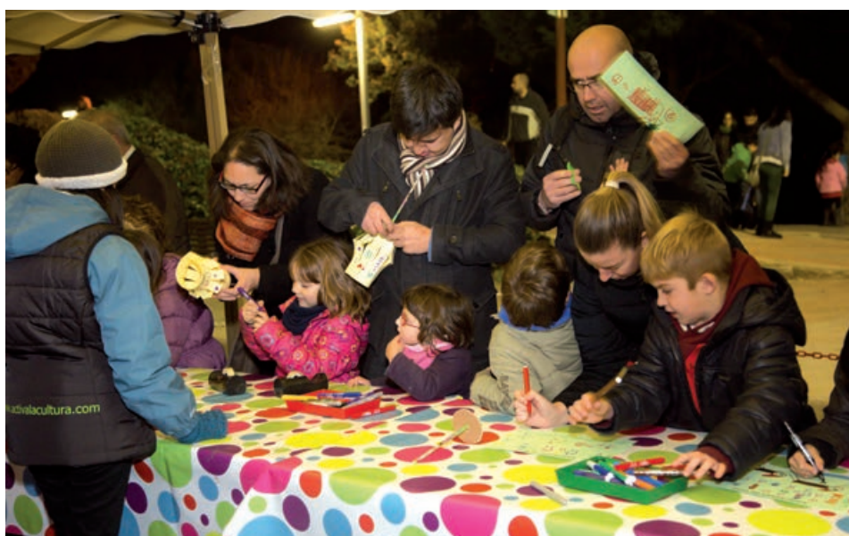
Els infants seran protagonistes de moltes de les activitats.

Tradicions com l'exposició de Diorames de Nadal , les representacions d' Els pastorets i d' El poema de Nadal , els concerts de nadeses o el Festival de valsos i danses segueixen sent alguns dels principals atractius de l'extensa programació de Nadal que han preparat els diferents serveis de l'Ajuntament per a aquest mes de desembre i principis de gener. Infants i adults podran gaudir de nombroses propostes amb regust nadalenc en equipaments com l'Ateneu, la Biblioteca o La Cruïlla, on tindran lloc durant aquests dies tallers d'elaboració de postals, decoració i dolços nadalencs, entre moltes altres temàtiques.