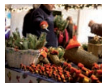
FIRA DE NADAL LES PARADES TORNEN A LA PL. DR. GUARDIET

La ciutat es torna omplir d'activitats de tot tipus amb motiu de les festes nadalenes. Sota l'enllumenat propi d'aquestes dates, conflueixen un cop més cultura i tradició, propostes lúdiques per a grans i petits, fires i campanyes comercials. Una combinació pensada per viure i gaudir del Nadal a Rubí.