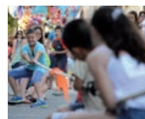
UNA FESTA FAMILIAR ACTIVITATS PER A GRANS I PETITS OMLIRAN ELS SIS DIES DE FESTA MAJOR.

La cultura popular serà una altra de les potes de la programació de la Festa Major 2017: una vegada més, la participació de les colles i entitats de cultura d'arrel tradicional serà important per omplir els carrers de vida i activitats.