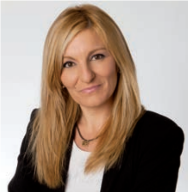
Ana María Martínez Martínez Alcaldesa de Rubí

La celebració de la Festa Major de la ciutat torna a aparèixer a l'horitzó, i amb ella, aquell esperit que ens assalta. Un sentiment d'alegria sense límit, d'ansietat per ocupar carrers i places, de retrobar-nos tots i totes al carrer. Aquest sentiment de pertinença és el combustible d'una ciutat que palpita, que viu, que s'encén des del pregó fins al piromusical. Una comunicació entre ciutadania i ciutat. Un esclat de joia que causa admiració. El millor moment per compartir les nostres similituds i celebrar les nostres diferències.