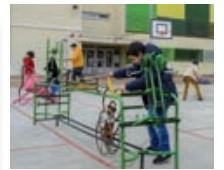
DETALL DE LA INAUGURACIÓ EL PATI ES DINAMITZA CADA CAP DE SETMANA.

Des del 21 de gener passat, el pati de l'Escola Pau Casals obre tots els dissabtes i diumenges de 10 a 14 h i de 16 a 20 h. Per poder-hi accedir no cal ser alumne d'aquest centre ni fer cap inscripció prèvia, sinó que l'espai està disponible per a tothom sempre que respecti unes normes d'ús bàsiques. El pati compta amb un monitor que en garanteix el bon funcionament, s'encarrega de les funcions d'obertura i tancament del recinte, el dinamitza proposant jocs per a diferents franges d'edat i vetlla perquè hi hagi una bona convivència i s'hi mantinguin actituds cíviques. Com a qualsevol espai públic de la ciutat, però, la responsabilitat dels infants recau en les famílies i, de fet, els usuaris menors de dotze anys hi han d'anar acompanyats d'una persona adulta.