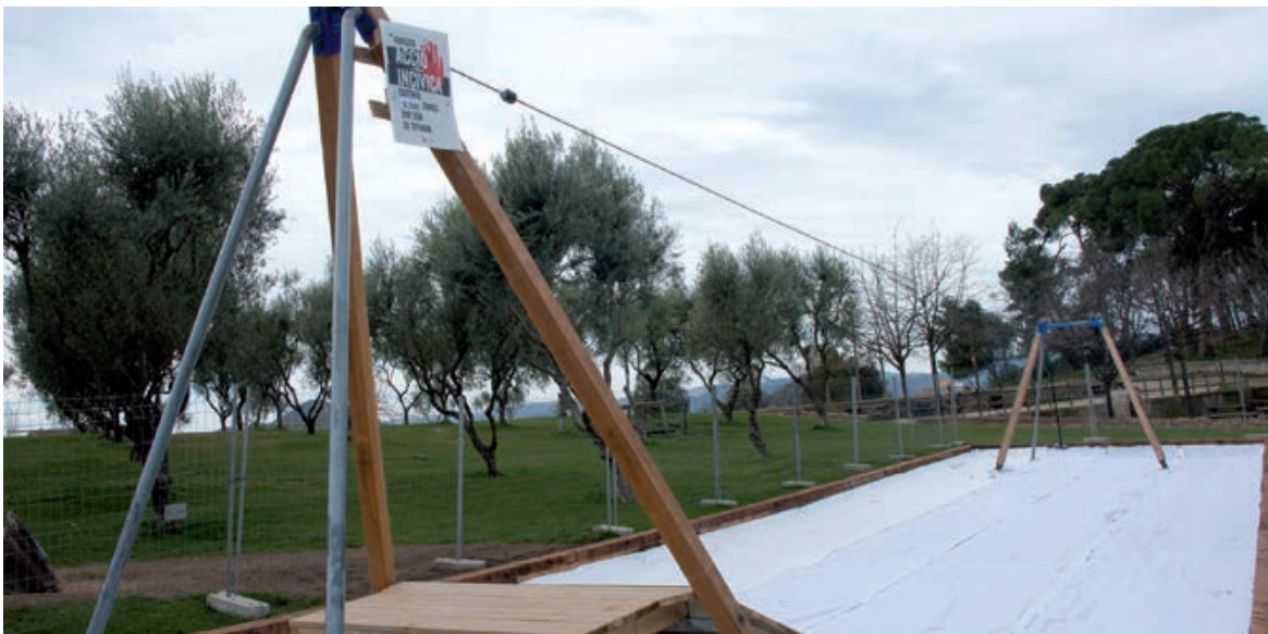
LA TIROLINA DE CA N'ORIOL ACUMULA DIVERSOS ARRENJAMENTS A CAUSA DE LES BRETOLADES QUE HA PATIT.

M antenir una ciutat agradable i sostenible a partir de la col·laboració entre l'Administració i la ciutadania és un dels objectius que s'ha fixat el consistori de cara als pròxims anys. Amb aquesta idea, des de diferents àrees municipals s'han posat en marxa en els darrers mesos iniciatives que apunten en aquesta direcció.