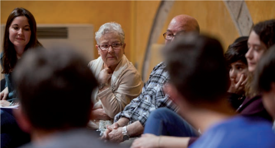
AVIS I JOVES VAN COMPARTIR EXPERIÈNCIES SOBRE MIGRACIONS.

L a història de les dones que van treballar a les fàbriques rubinenques dedicades al tèxtil, les persones que van arribar a la ciutat cercant un futur millor i la dictadura són alguns dels temes que les persones grans del municipi traslladaran a les generacions més joves.