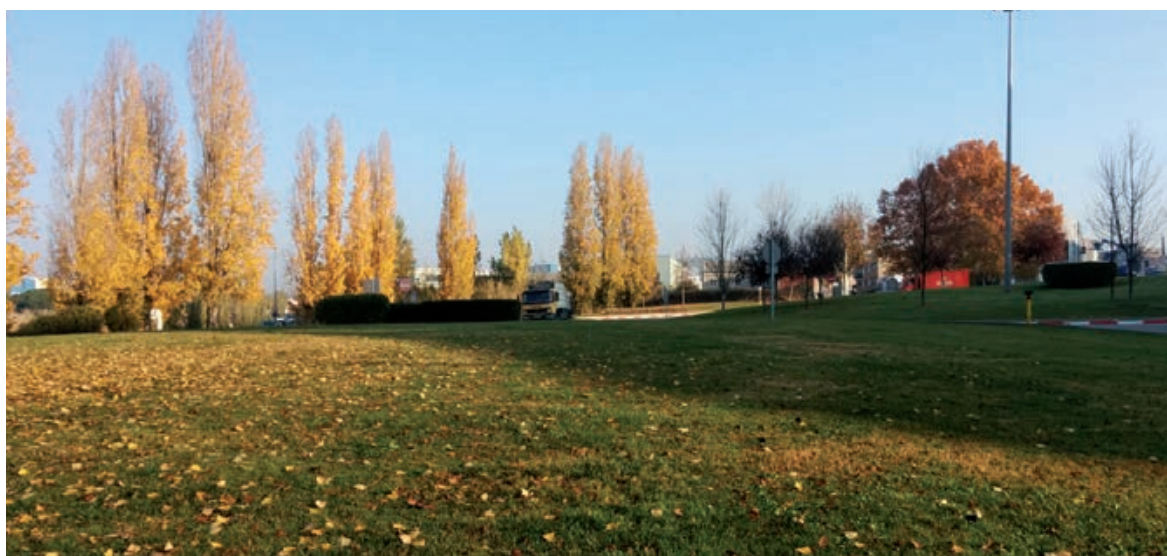
ZONA D'ESBARJO ES DOTARÀ D'IL·LUMINACIÓ AQUEST ESPAI

L a ciutadania que ha participat a la segona edició del projecte Alcaldia als barris ha fet arribar a la màxima representant municipal les seves demandes. Totes aquestes peticions han estat estudiades pels tècnics municipals i, ara, bona part d'elles es començaran a executar.