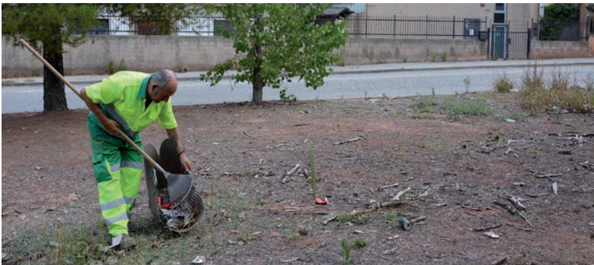
OPERATIVO ESPECIAL EN LOS PAE CADA 6 MESES SE REFUERZA LA LIMPIEZA EN LOS POLÍGONOS

Una vez completada la limpieza, el servicio de Parques y Jardines ha desbrozado los diferentes polígonos. En este caso, las cinco personas contratadas a través de planes de ocupación también han apoyado al personal propio del servicio municipal para eliminar las hierbas que crecen en los alcorques y en las aceras de los polígonos.