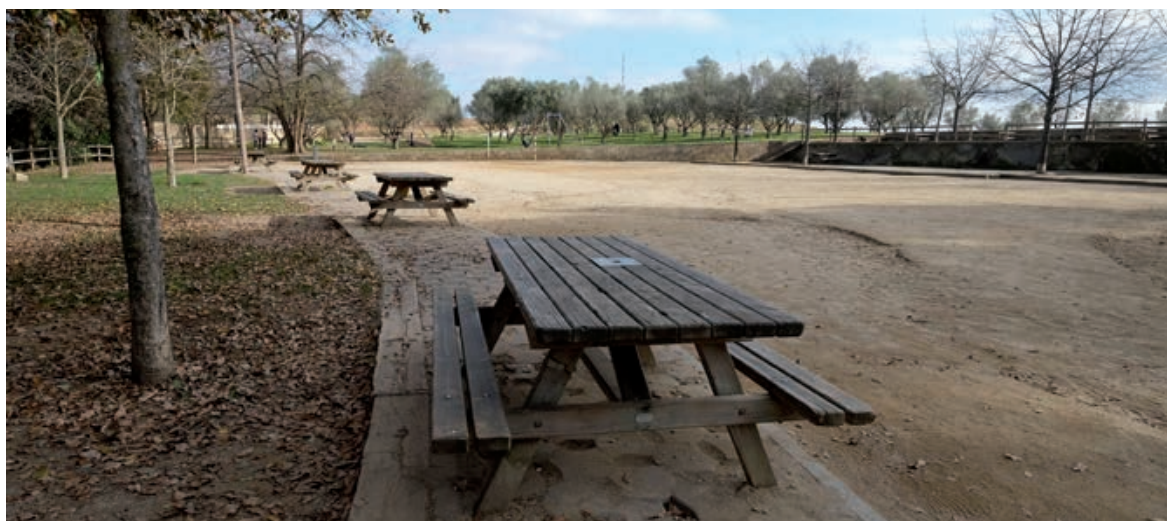
PARC DE CA N'ORIOI ÉS UN DELS ESPAIS ON S'ACTUARÀ

L' Ajuntament ha dissenyat un nou Pla d'inversions per valor de 15'6 milions d'euros amb l'objectiu de millorar la ciutat. Es tracta de tot un seguit de projectes que donen compliment als objectius de mandat de l'equip de govern i que passen per tenir una ciutat accessible per a tothom i amb visió d'infància, donar suport a l'activitat econòmica a través de la millora dels parcs empresarials de la ciutat, dotar Rubí d'una xarxa ciclista que possibiliti la mobilitat sostenible i la pràctica de l'esport, i millorar i potenciar diversos equipaments, entre d'altres.